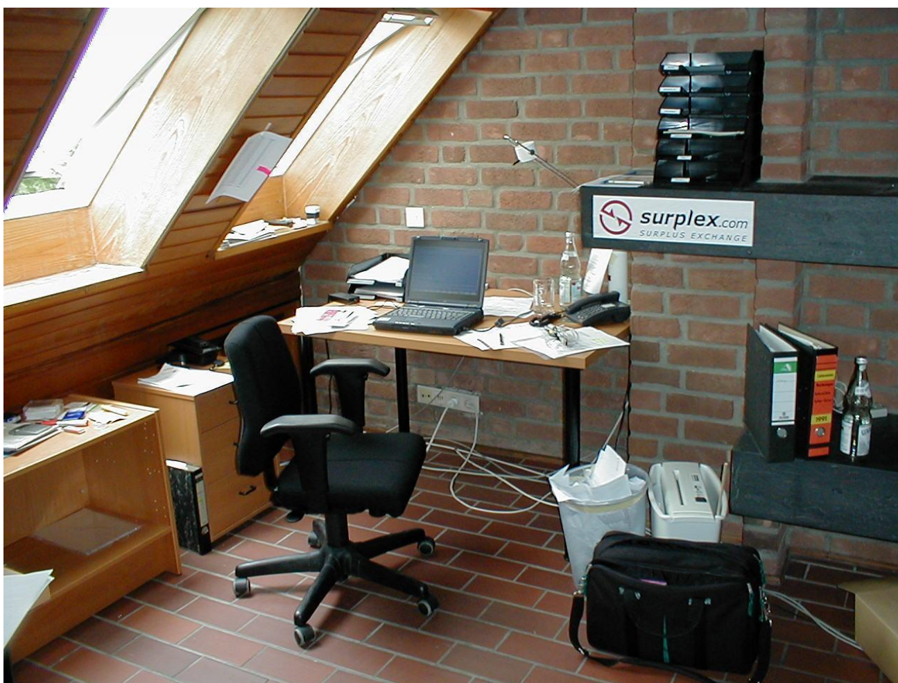
1999 : le premier bureau du Surplex