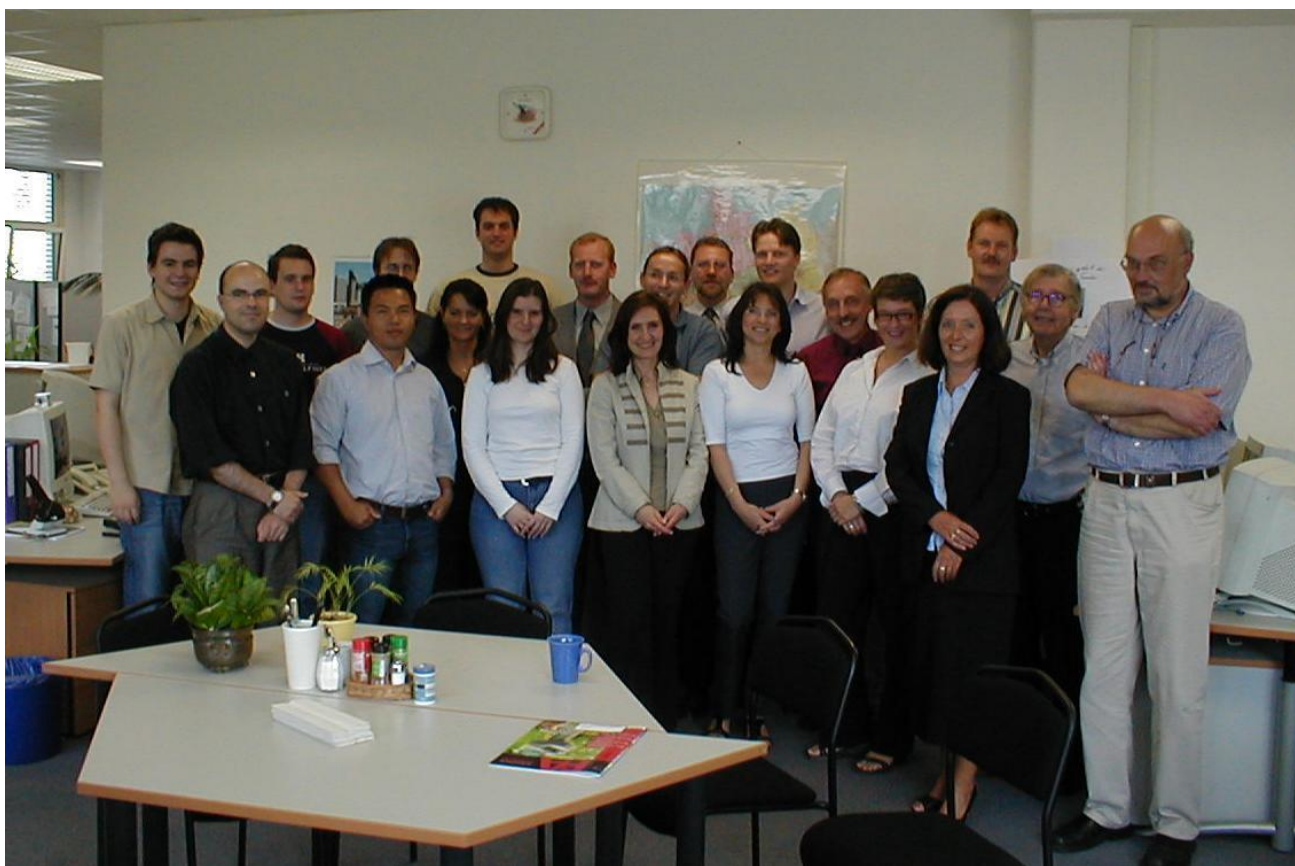
2004 : l'équipe Surplex au complet