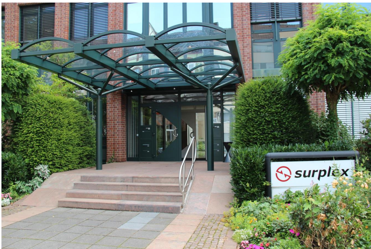
2009 : le premier bureau de la nouvelle société Surplex GmbH