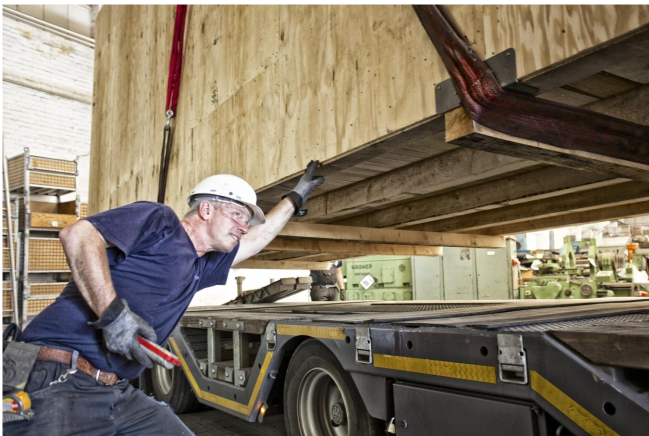
2011 : chargement des machines