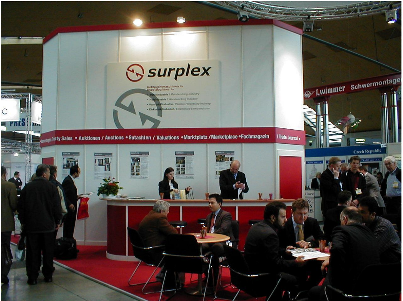
2007 : stand d'exposition à RESALE